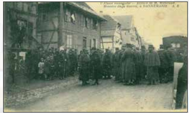
L'Alsace reconquise : arrivée de M. MILLERAND, Ministre de la Guerre à Dannemarie