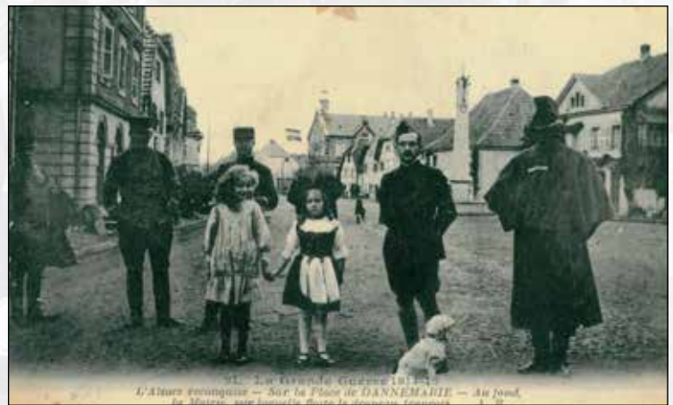
Sur la place de Dannemarie

Nous invitons la population à participer aux commémorations du 8 août (voir agenda pour le programme détaillé) et à pavoiser les maisons. En cas de besoin, des drapeaux sont disponibles en mairie.